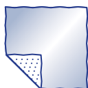
Handrička na čistenie